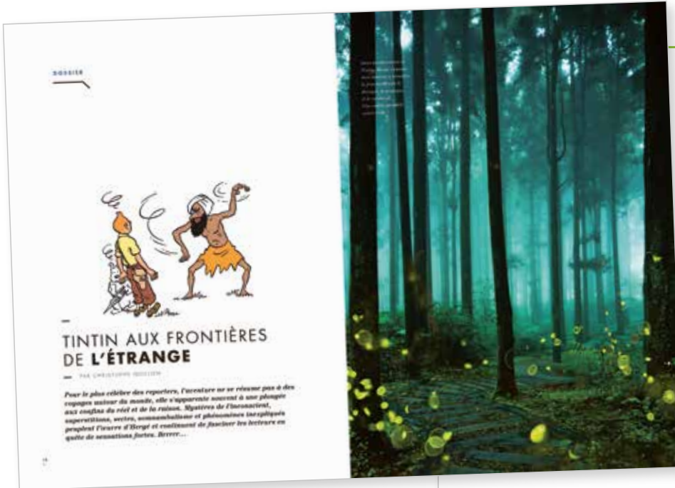
UN GRAND DOSSIER thématique

UN GRAND ENTRETIEN AVENTURE avec des personnalités emblématiques de l'aventure aujourd'hui