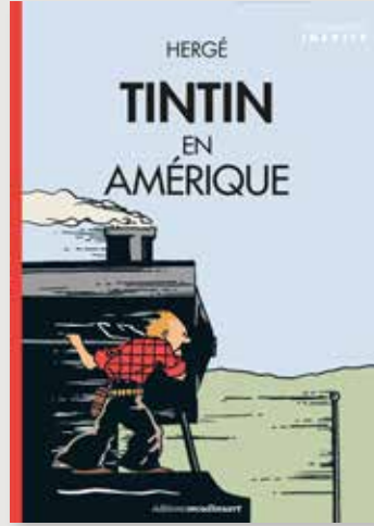
COUVERAMERIQUE COLORISE LOCOMOTIVE FR.jpeg

Éditions Moulinart 162 avenue Louise, B-1050 Bruxelles Tél +32 (0)2 626 24 21