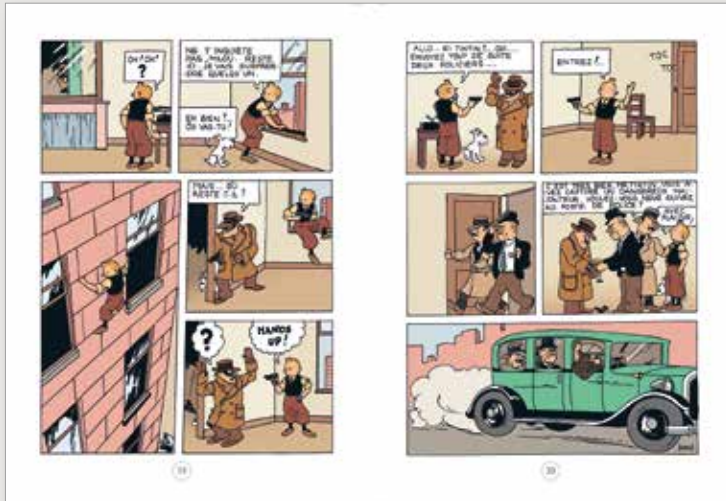
AMERIQUE COLORISE_PAGES 19-20FR.jpeg