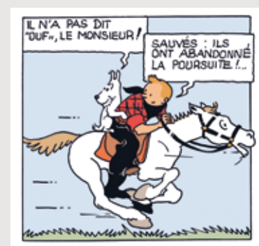
AMERIQUE COLORISE P71 A1FR.JPG