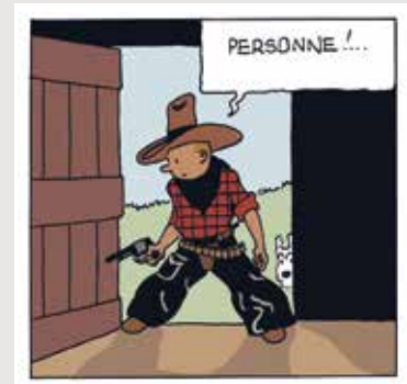
AMERIQUE COLORISE P32 B1FR.JPG