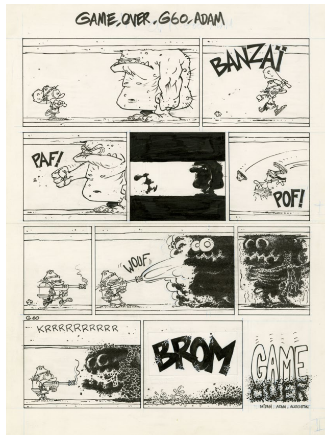
Game Over – No problemo – Page 10 – Gag 60