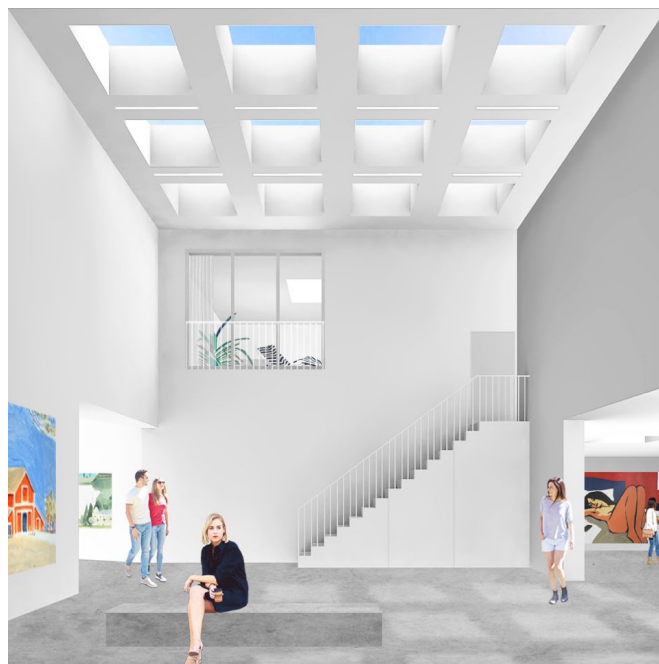
simulatie voorgesteld door estate estate architectes