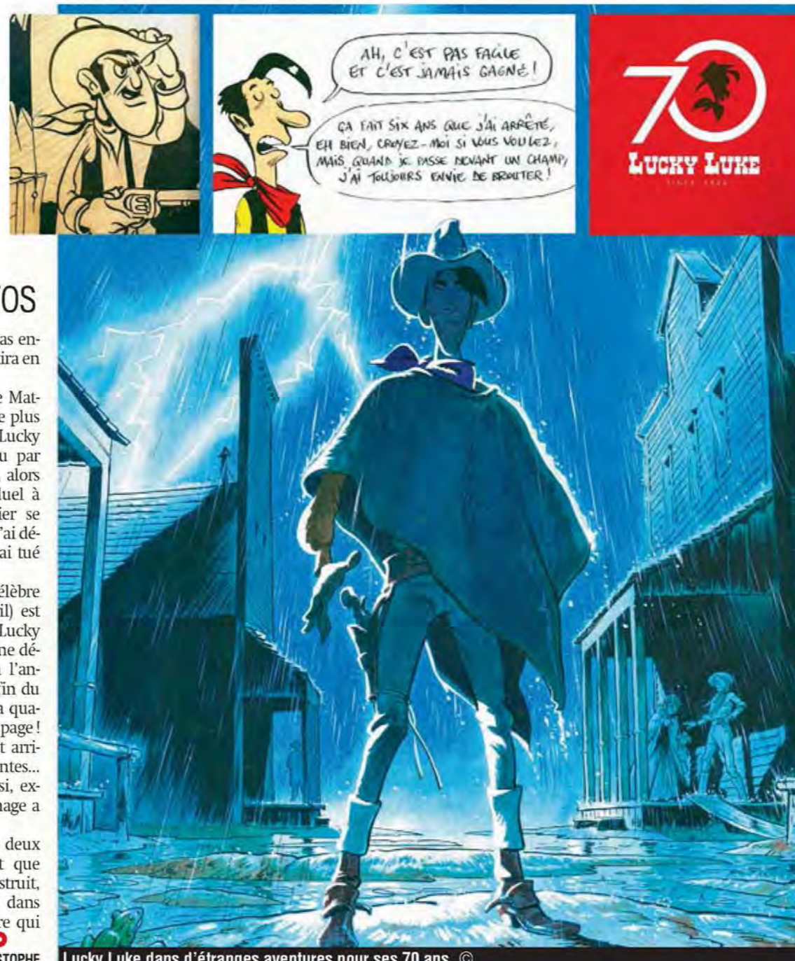
Lucky Luke dans d'étranges aventures pour ses 70 ans.