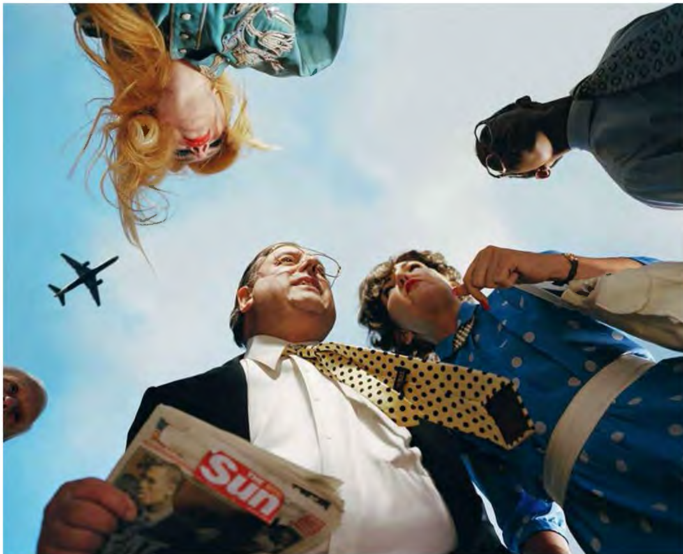
Hazelwood #2 (after Steven Siegel), 2014 van ALEX PRAGER