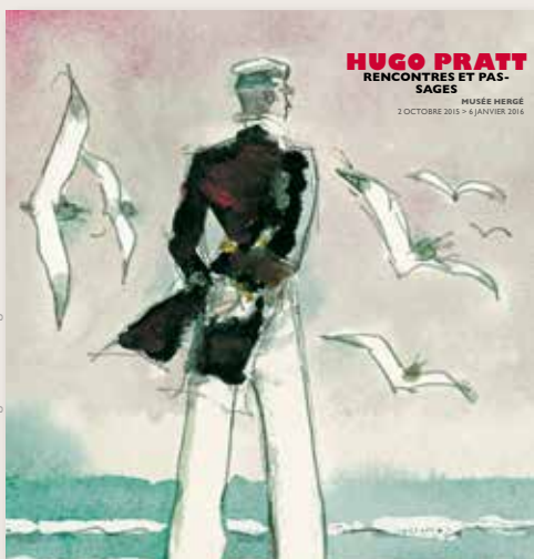
Dessin de couverture Hugo Pratt